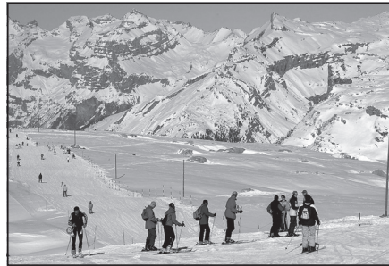
Doc. 3 Ski dans une petite station en Haute-Savoie : Flaine.