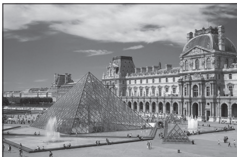
Doc. 5 Musée du Louvre à Paris.

Activités : Ici l'activité représente la randonnée, donc activité verte, mais la Guadeloupe présente un superbe littoral