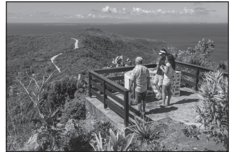
Doc. 4 Randonnée de touristes en Guadeloupe.