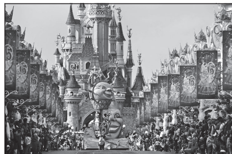
Doc. 6 Parc d'attraction de Disneyland Paris à Marne-la-Vallée.