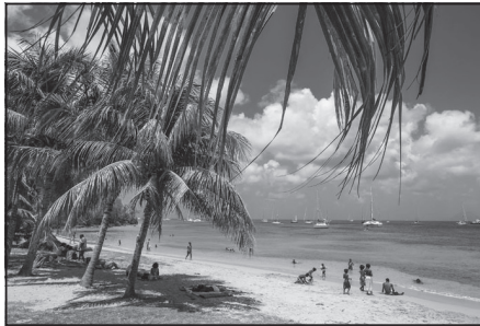
Doc. 2 Plage de la Martinique.