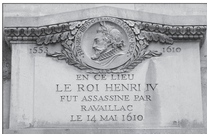
Doc. 5 Plaque de marbre ; 11, rue de la Ferronnerie à Paris.

Henri IV est assassiné dans son carrosse par un fanatique catholique.